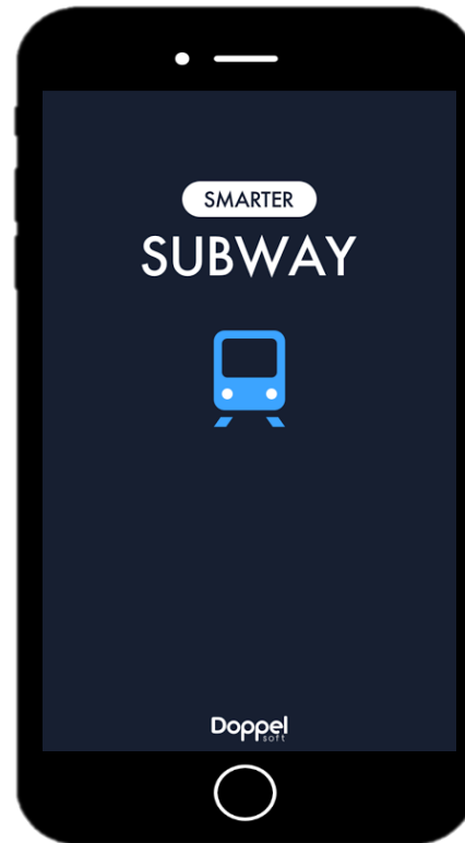
지하철종결자 (AOS, iOS) 지하철 정보 안내 앱